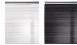
アルベロホワイト柄 アルベロブラック柄