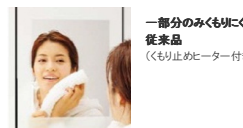
一部分のみくもりにくい従来品（くもり止めヒーター付き）