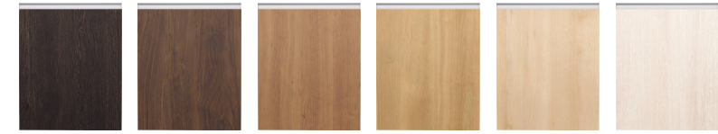
スモークオーク柄 ウォールナット柄 チェリー柄 オーク柄 メープル柄