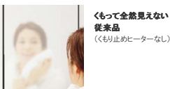
くもって全然見えない従来品（くもり止めヒーターなし）