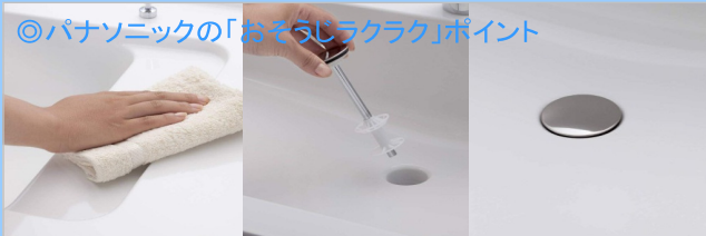
継ぎ目や隙間がないカウンター。汚れてもささっと拭くだけ。 壁のモノなどのゴミをささっと取り除けるヘアキャッチャー。 掃除しにくかったフチの隙間がない排水口。