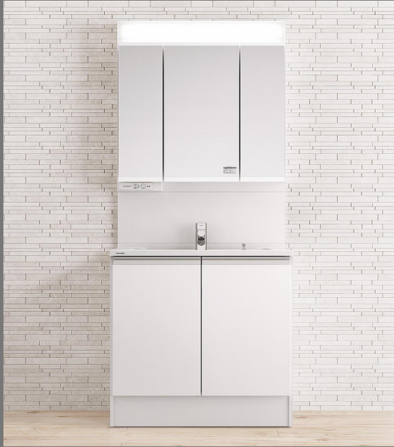
※イメージ写真（画像の仕様詳細は、ご提案のプランと異なる部分があります）