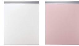
ホワイト(鏡面) ピンク(鏡面)