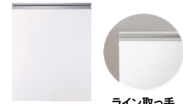
ホワイト ライン取っ手