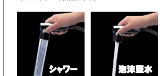
ヘッドは引出して、お掃除や花瓶の水入れなどにご利用頂けます。